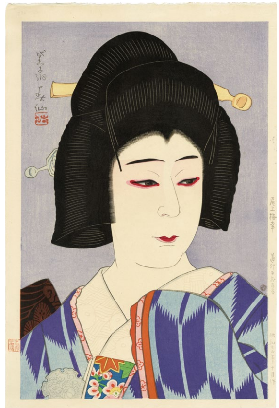
220. 七代目尾上梅幸 道行のおかる ¥140,000 昭和26年 刷保存優良 マージンに印