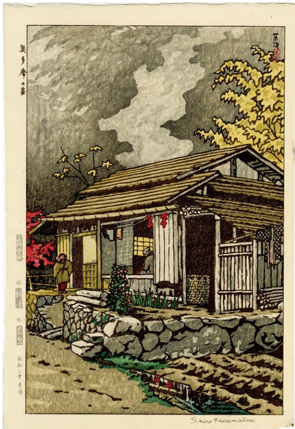
233. 奥多摩の家 ¥100,000 昭和 30 年 刷保存優良 芸艸堂版