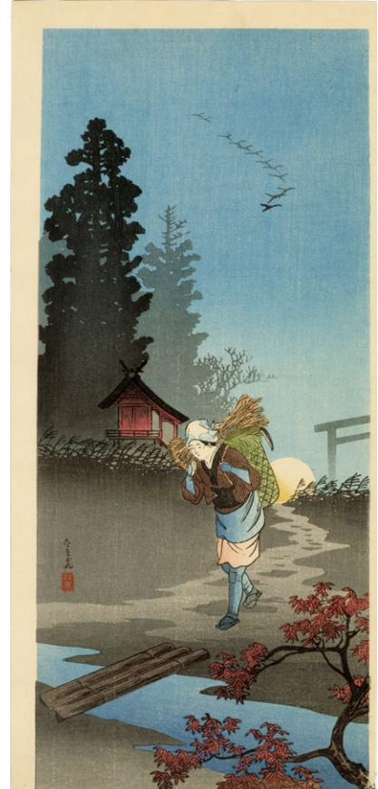
229. たそがれ 刷保存優良 ¥120,000