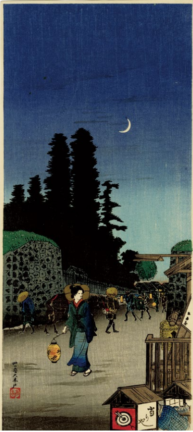
224. 四つ谷 大木戸 刷保存優良 ¥160,000