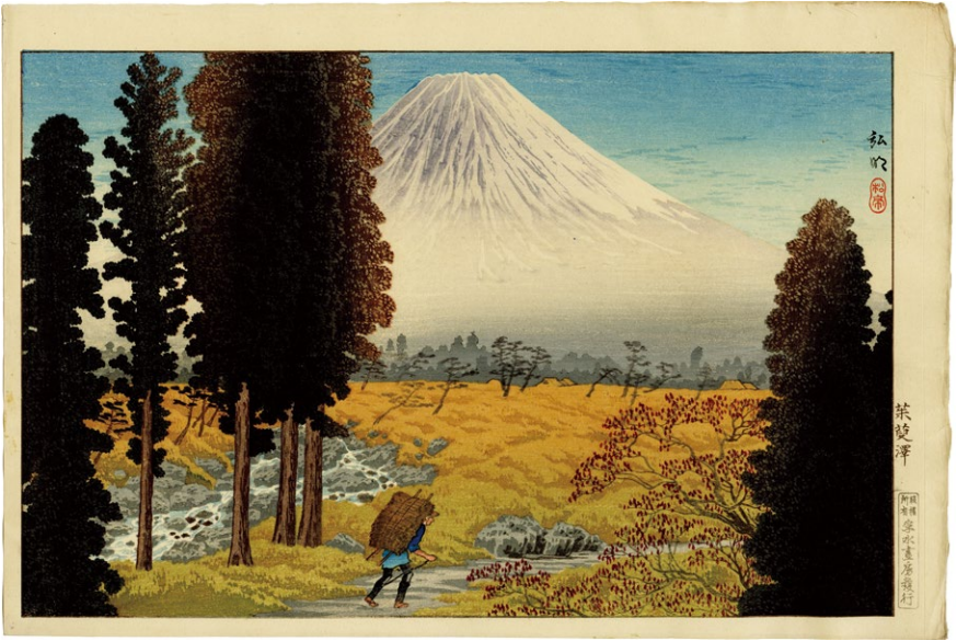
223. 茶莢澤 昭和4-7年 刷優良 孚水画房版 ¥380,000