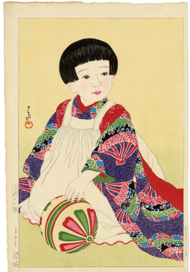
209. 子供十二題 手まり ¥300,000 昭和6年 刷優良 薄いシミ