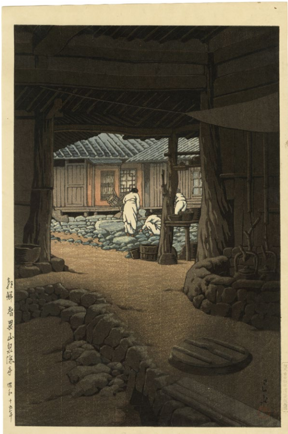
212. 朝鮮智異山泉隠寺 ¥700,000 昭和15年 刷保存優良