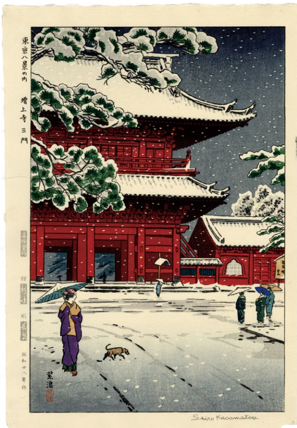
232. 東京八景の内 増上寺三門 ¥160,000 昭和 28 年 刷保存優良 芸艸堂版