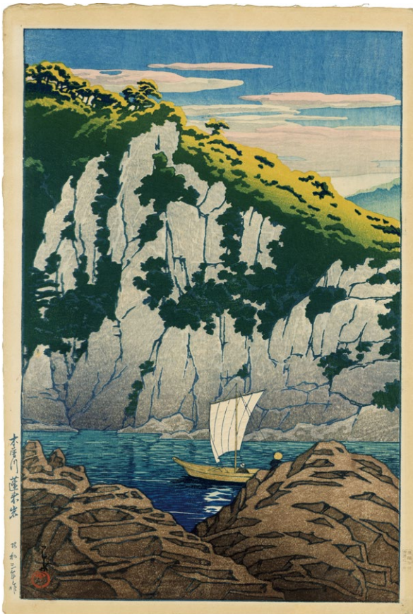
208. 木曾川蓬萊岩 ¥800,000 昭和3年 刷優良 マージンに少ヤケ 左下角に折れ