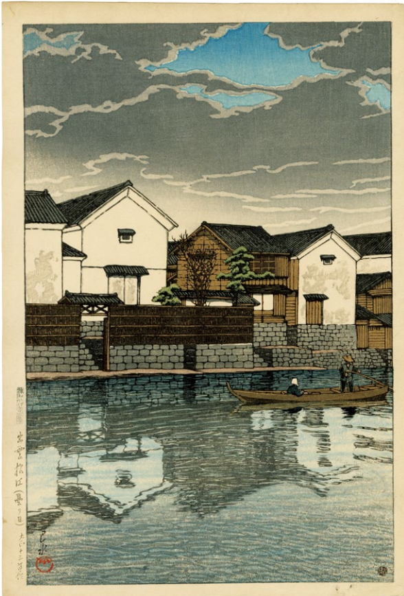
210. 旅みやげ第三集 出雲松江 (曇り日) ¥1,200,000 大正13年 刷優良