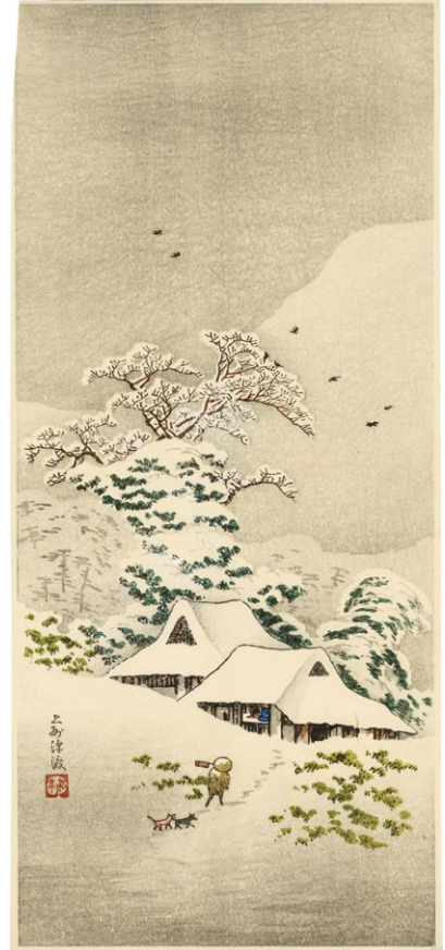
226. 上州澤渡 刷優良 ¥120,000