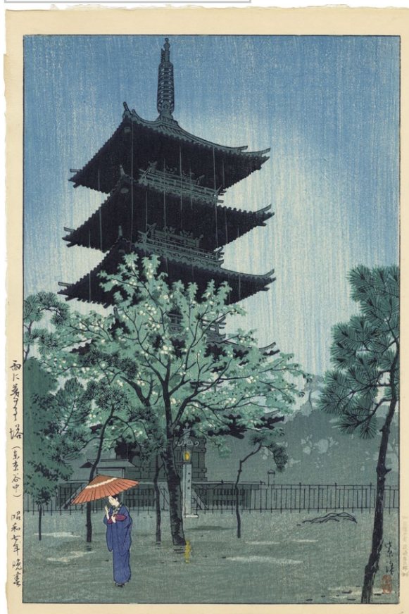
231. 雨に暮るる塔 (東京谷中) ¥280,000 昭和 7 年 刷保存優良 渡辺版