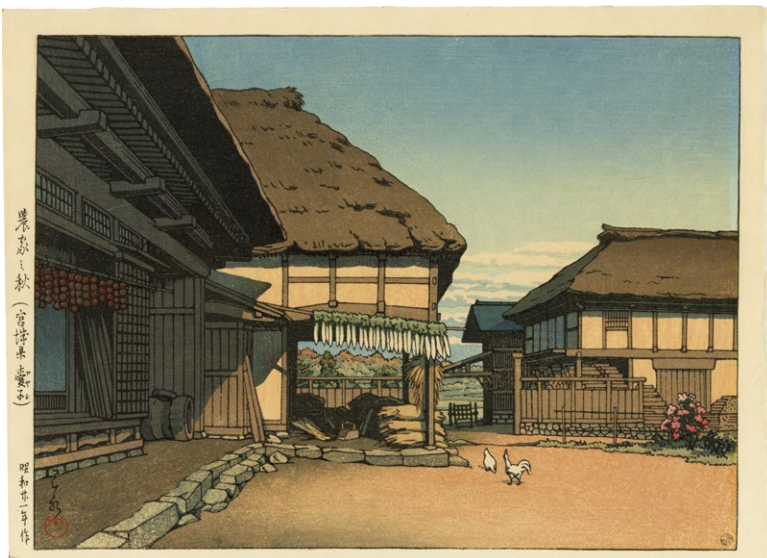
216. 農家之秋 (宮城県愛子) 昭和21年 刷保存優良 少ヤケ