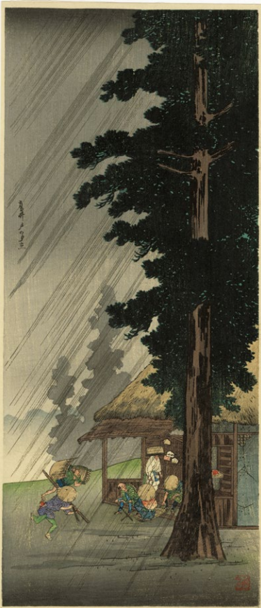
227. 高井戸の夕立 刷保存優良 ¥120,000