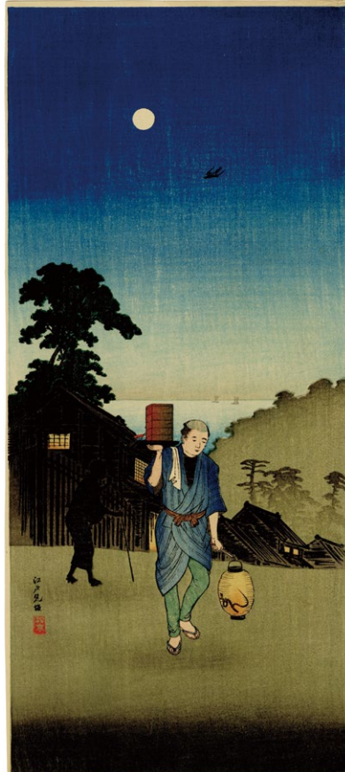
225. 江戸見坂 刷保存優良 ¥160,000