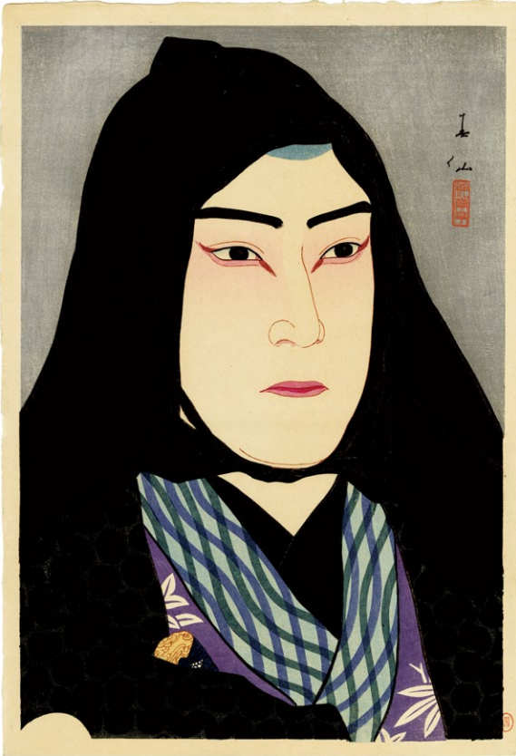
217. 四代目 中村福助 毛剃の宗七 ¥180,000 昭和2年 刷保存優良