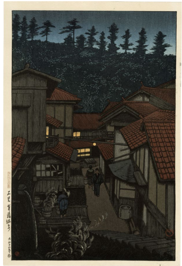
207. 旅みやげ第二集 石見有福温泉 ¥900,000 大正13年 刷保存優良 題名にずれ