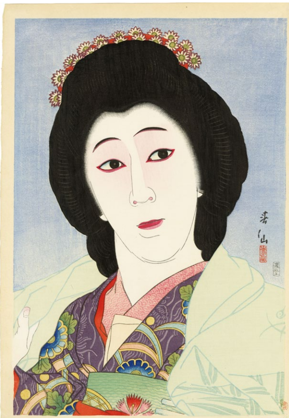
219. 六代目尾上梅幸 房橋の小百合 ¥160,000 大正14年 刷優良 裏面に書込跡とテープ