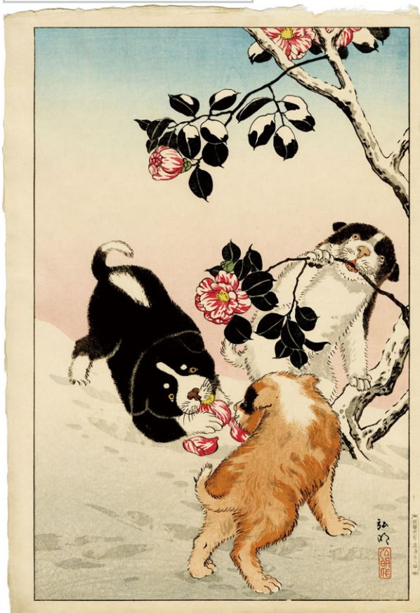
230. 雪中の椿と子犬 ¥500,000 昭和 10 - 16 年 刷保存優良