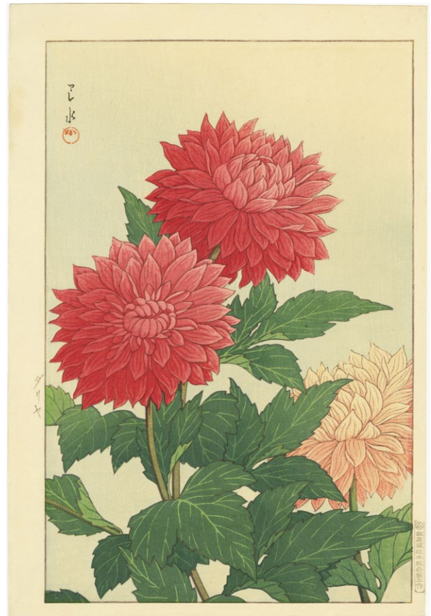
213. ダリヤ ¥700,000 昭和15年 刷優良 マージンに少汚れ