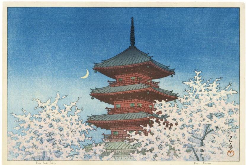
215. Ueno Park, Tokyo