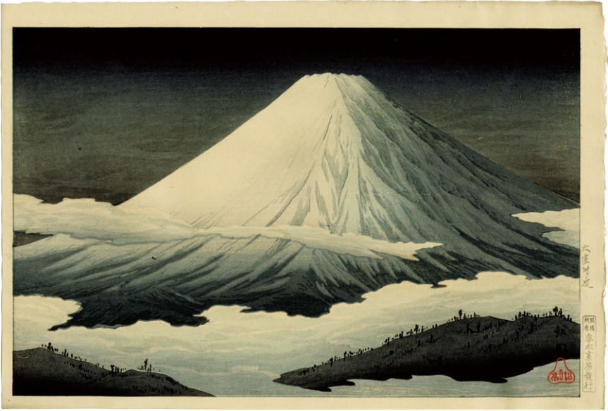
221. 大室付近 昭和4-7年 刷優良 孚水画房版 ¥380,000