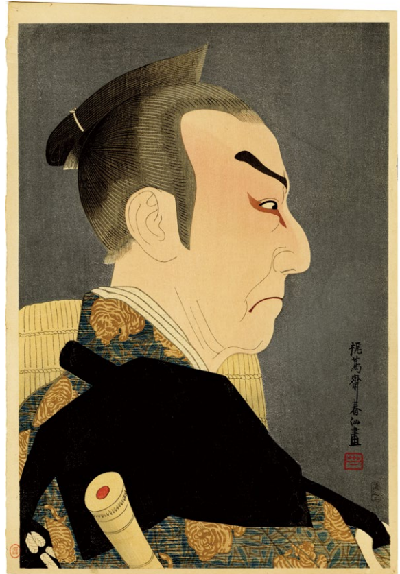
218. 十一代目片岡仁左衛門 九段目 本蔵 ¥150,000 大正14年 刷優良 裏面に少ヤケ 元タウ付