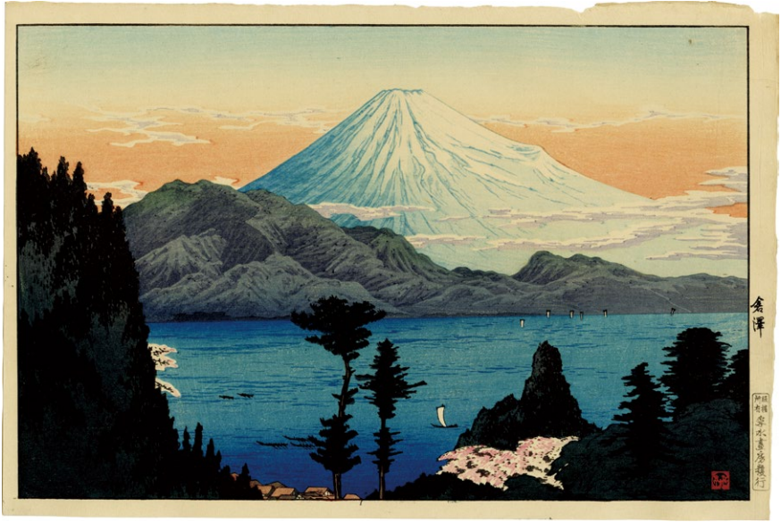
222. 倉澤 昭和4-7年 刷優良 少汚れ 孚水画房版 ¥350,000