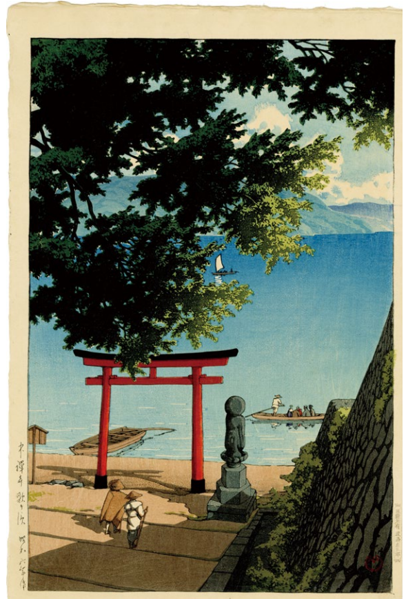
211. 中禅寺 歌ヶ浜 昭和6年 刷保存優良 ¥850,000